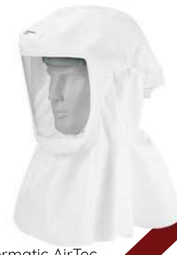
Evermatic AirTec EV2 huppu, pitkä