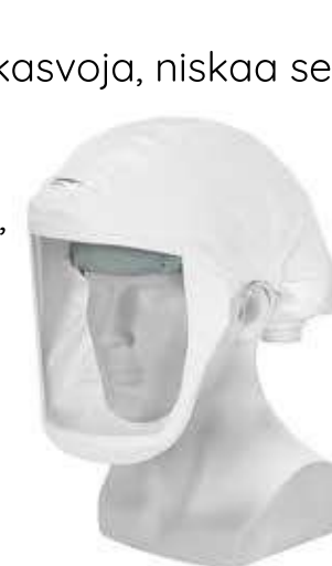
Evermatic AirTec EV1 huppu, lyhyt